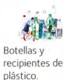
Botellas y recipientes de plástico.